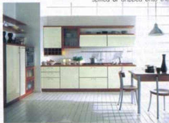
2 - Una cucina verniciata con la nuova finitura Technofinish di Ilva.

Technofinish products protect the wood from a harmful domestic liquids that can be spilled or dripped onto the surfaces, and from detergents which are indispensable for cleaning and for the hygiene of the kitchen.