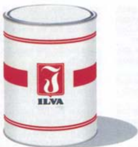
1 - Una latta tradizionale Ilva.

✉ Seguire il sito cartolina.informazioni